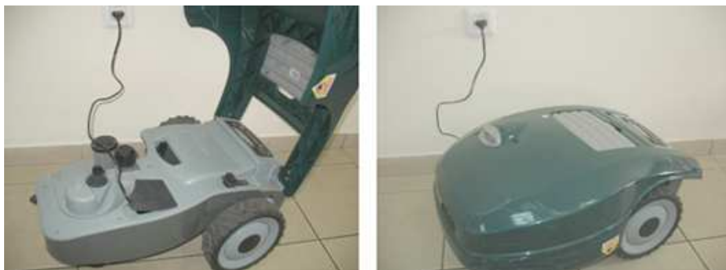
Nabíjení v zimě

Vložte pojistku baterií a zimní nabíječku připojte k přívodu ze sítě na celé období, kdy Robomow® nebude v provozu ; Ověřte, že se zobrazuje “Nabíjení” a “Hotovo – stále nabíjete”, když je baterie plně nabitá.