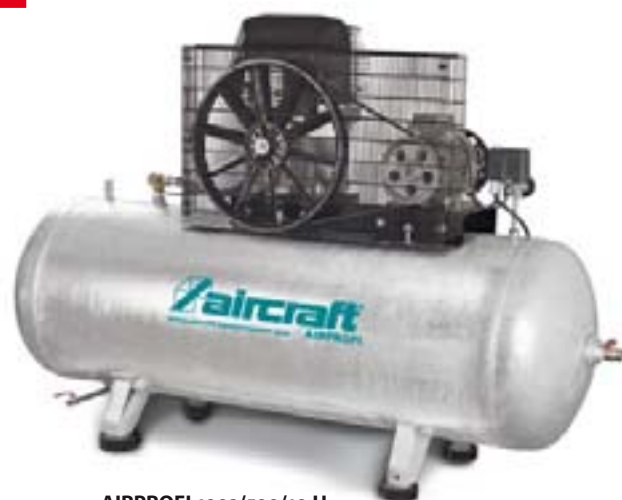
AIRPROFI 1003/500/10 H Pohled zezadu