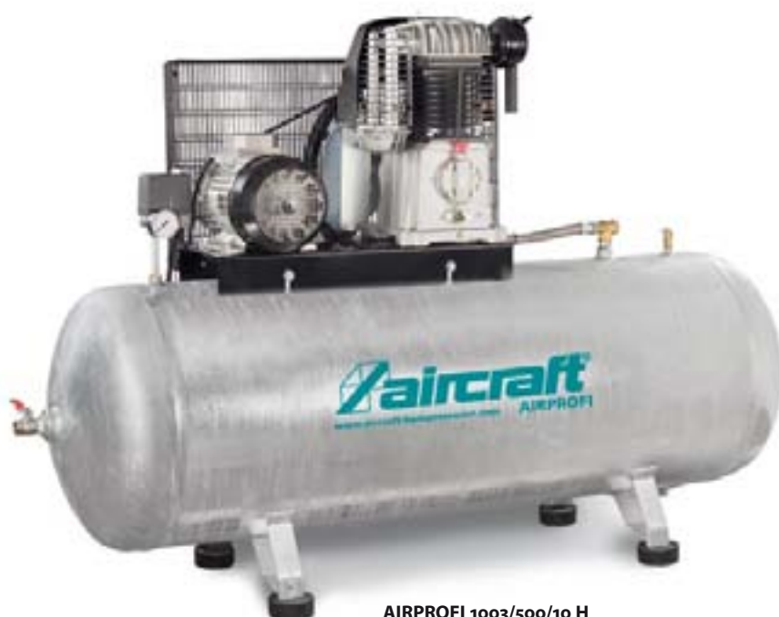
AIRPROFI 1003/500/10 H s tlakovou nádobou 500 l pro maximální výkon a zásobu stlačeného vzduchu.

Žárově zinkované tlakové nádoby Záruka 15 let proti prorezavění