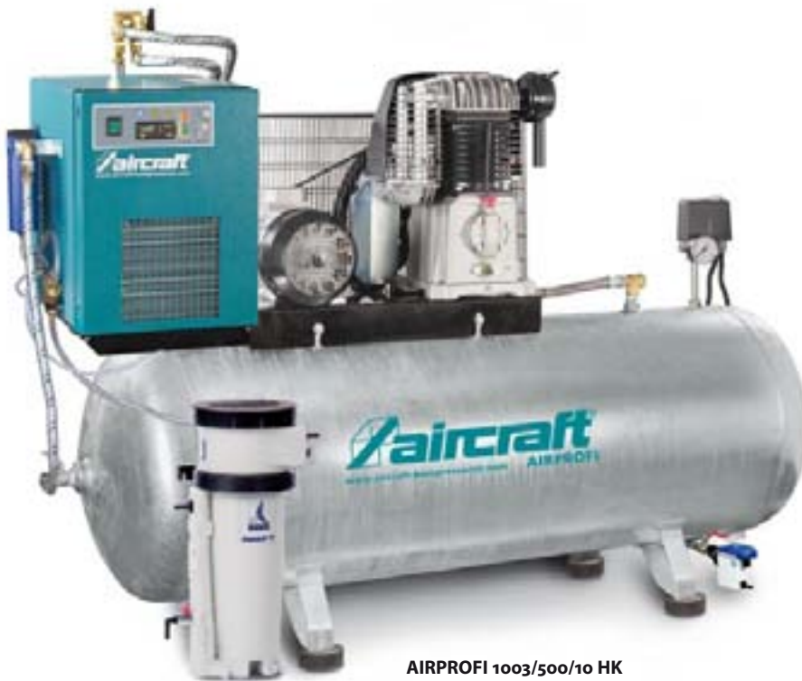
AIRPROFI 1003/500/10 HK AIRPROFI 903/500/15 HK