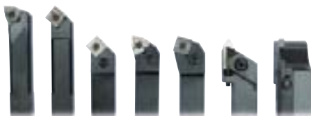
Soustružnické nože HM 20 mm, sada 7 ks