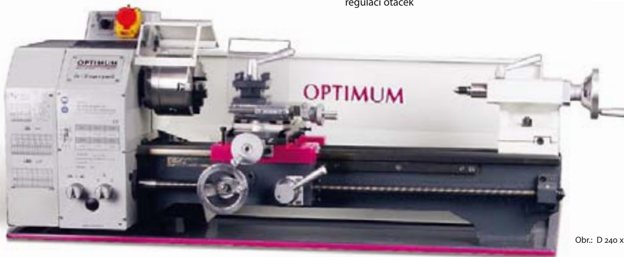
Obr.: D 240 x 500 G